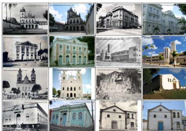
Fig. 05 - Jogo de Memória disponibilizado na página.

• Centro histórico - busca ressaltar a importância do tombamento do centro histórico de João Pessoa, a princípio reconhecido pelo Instituto do Patrimônio Histórico e Artístico do Estado da Paraíba - IPHAEP, e mais recentemente, em 2007, pelo IPHAN, Instituto do Patrimônio Histórico e Artístico Nacional. É um espaço que visa esclarecer conceitos básicos acerca do tombamento e expor as delimitações da área de proteção.