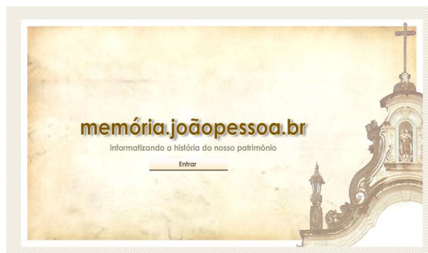
Fig. 01- Página de apresentação da Homepage