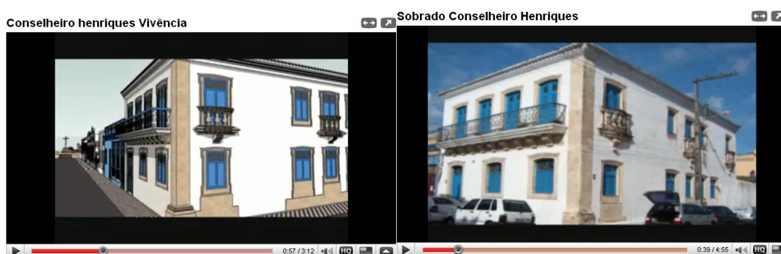
Figs. 03 e 04 - Vídeos sobre o sobrado conselheiro Henriques. Acima o explicativo histórico e abaixo a maquete do passeio virtual.